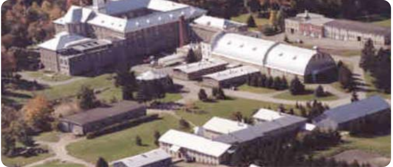
Abbaye cistercienne d'Oka