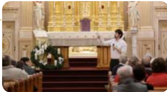
Lors de la visite de l'église Saint-Charles-Borromée

Dans un même ordre d'idées, la série de visites intitulée « Découvrez les trésors sacrés de Québec » a été un franc succès et a permis aux amateurs de patrimoine religieux de découvrir différentes églises des arrondissements de Québec.