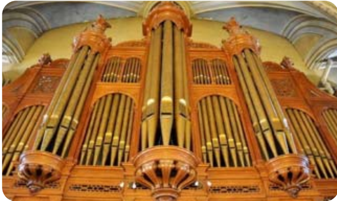
Grand orgue église Saint-Jean-Baptiste