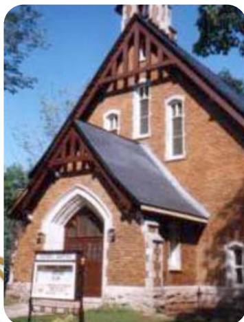
Église Baptist de Québec